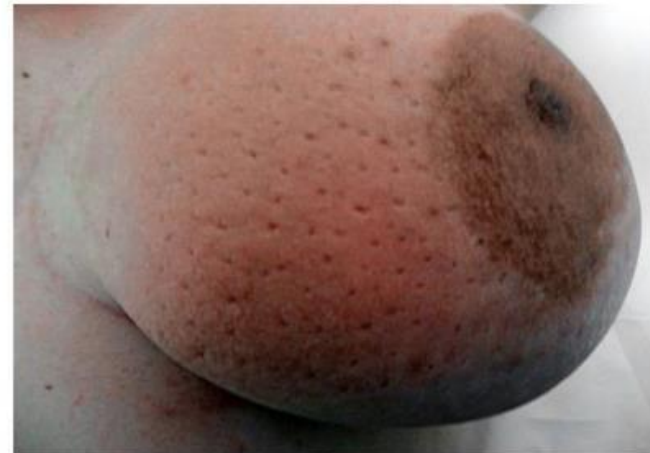
Pele da mama avermelhada ou parecida com casca de laranja