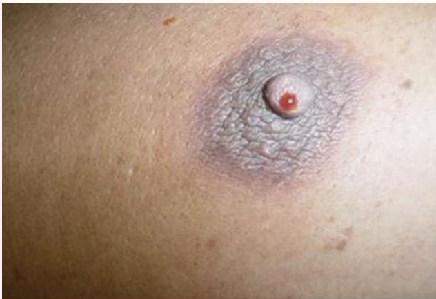
Saída espontânea de líquido dos mamilos